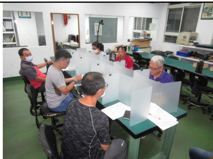
教學活動照片 1: 備課議課