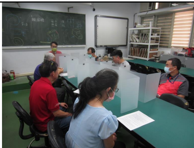
教學活動照片 2: 備課議課